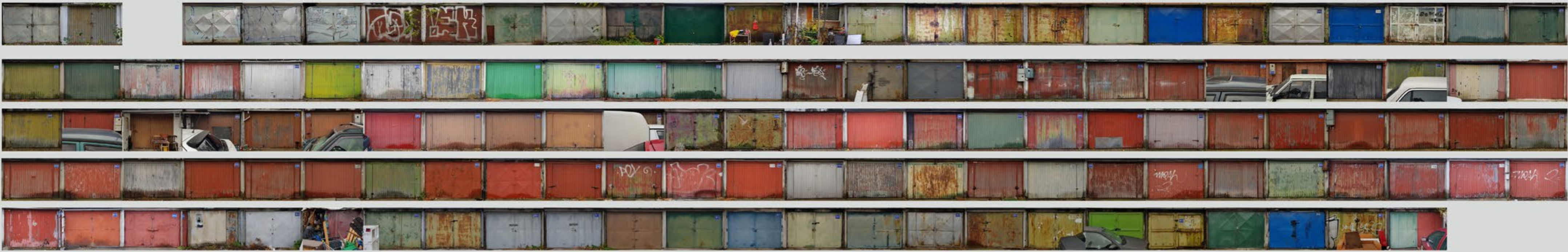
Reihe 3 | Row 3

Garages that lie next to each other and have the same colour may indicate that they belong to the same owner or that people have shared the colour for the painting. This, in turn, would point to a close-knit social network, with its spatial reach limited to the immediate neighbourhood.